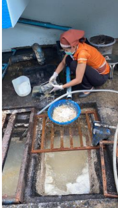
รูปที่ 2-13 แสดงไขมันที่ได้จากการตักออก จากถังดักไขมัน