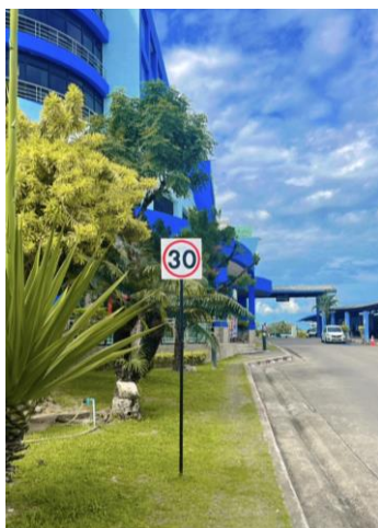
รูปที่ 2-29 ติดตั้งป้ายจำกัดความเร็วของรถไม่เกิน 30 กิโลเมตร/ชั่วโมง