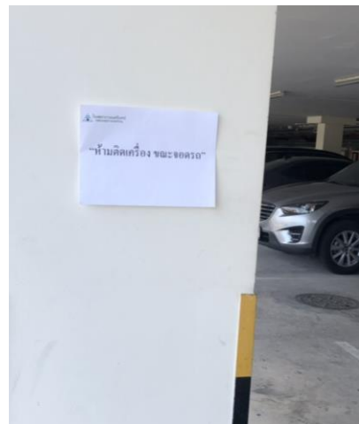
รูปที่ 2-28 ติดตั้งป้ายเตือน "ห้ามติดเครื่องขณะจอดรถ"