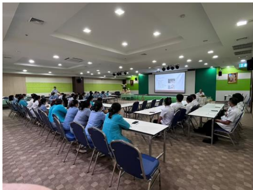
รูปที่ 2-33 จัดให้มีการอบรมให้ความรู้แก่พนักงานเกี่ยวกับกฎระเบียบต่างๆ