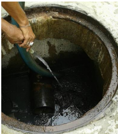
รูปที่ 2-9 แสดงถึงบำบัดน้ำเสียภายในโครงการ