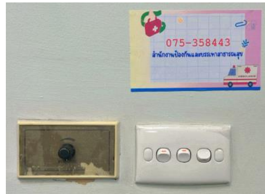
รูปที่ 2-34 ติดหมายเลขโทรศัพท์ของหน่วยงานที่ให้บริการด้านความปลอดภัยและป้องกันอัคคีภัยไว้ที่บริเวณสำนักงาน