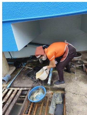
รูปที่ 2-12 แสดงการดักไขมันออกจากถังดักไขมัน เป็นประจำทุกวัน