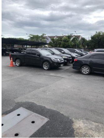
รูปที่ 2-25 จัดให้มีที่จอดรถ