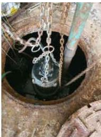
รูปที่ 2-11 บำรุงรักษาดักบำบัดน้ำเสีย