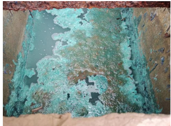
รูปที่ 2-10 แสดงถึงดักไขมัน