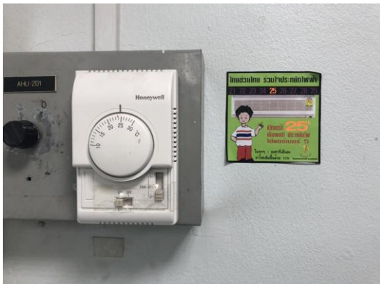
รูปที่ 2-3 แสดงป้ายประชาสัมพันธ์การประหยัดไฟฟ้า และตั้งอุณหภูมิ 25 องศาเซลเซียส