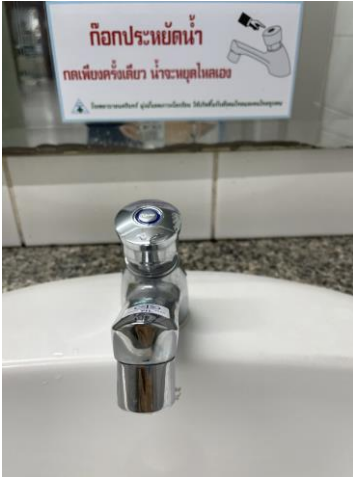
รูปที่ 2-7 ติดสติ๊กเกอร์รณรงค์การประหยัดน้ำ ที่บริเวณอ่างล้างมือ