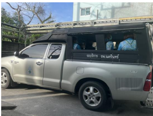
รูปที่ 2-5 ประชาสัมพันธ์ให้เจ้าหน้าที่ของโครงการ และผู้ใช้บริการใช้รถโดยสารสาธารณะ