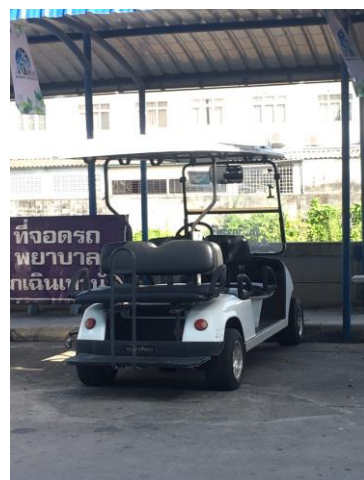
รูปที่ 2-30 จัดให้มีรถกอล์ฟ อย่างน้อย 2 คัน