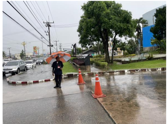
รูปที่ 2-26 จัดให้มีเจ้าหน้าที่อำนวยความสะดวกด้านการจราจร