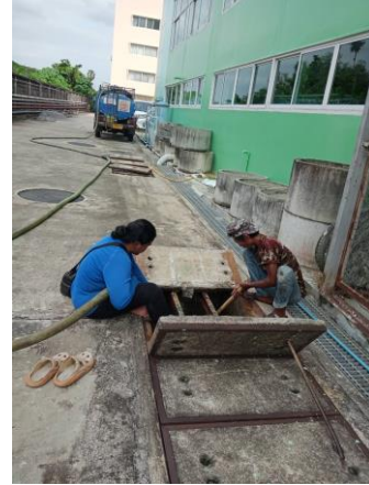
รูปที่ 2-14 กำหนดให้สูบน้ำจากถังแยกตะกอน