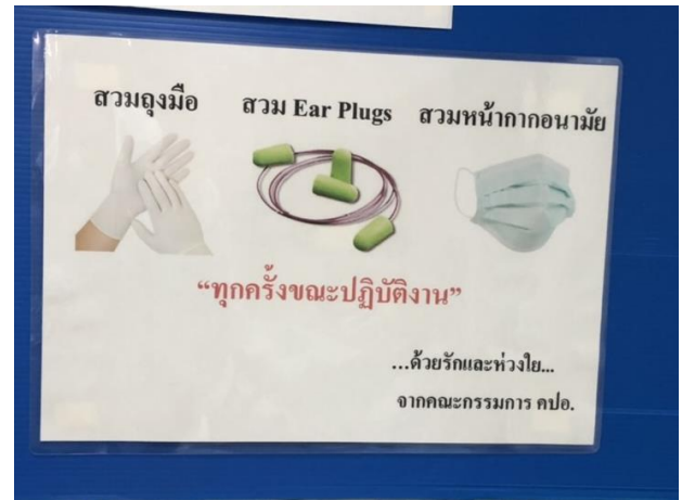
รูปที่ 2-32 รณรงค์และสร้างจิตสำนึกด้านความปลอดภัย