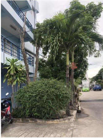
รูปที่ 2-1 แสดงพื้นที่สีเขียวภายในโครงการ