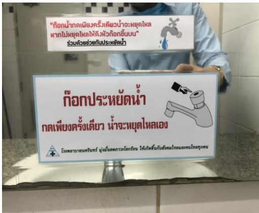
รูปที่ 2- 15 ประชาสัมพันธ์ให้ผู้มาใช้บริการ และพนักงานใช้น้ำอย่างประหยัด