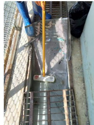
รูปที่ 2-16 ติดตั้งตะแกรงดักขยะที่บ่อพัก (สุดท้าย)