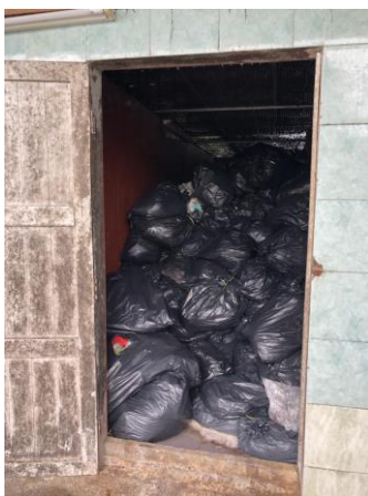
รูปที่ 2-17 จัดเก็บมูลฝอยในถุงดำรวบรวม ไว้ในที่พักมูลฝอยรวม