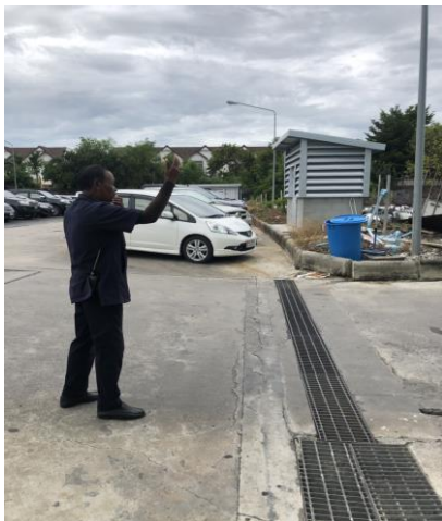
รูปที่ 2-27 จัดให้มีเจ้าหน้าที่อำนวยความสะดวกบริเวณลานจอดรถยนต์