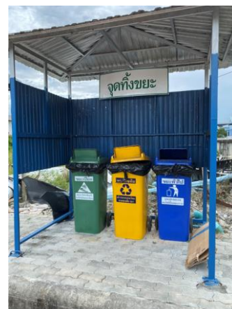
รูปที่ 2-18 เลือกใช้สีของถังรองรับมูลฝอย ตามประเภทของมูลฝอย