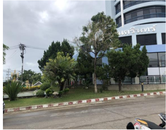
รูปที่ 2-2 ดูแลพื้นที่สีเขียวของโครงการ โดยเฉพาะไม้ยืนต้น