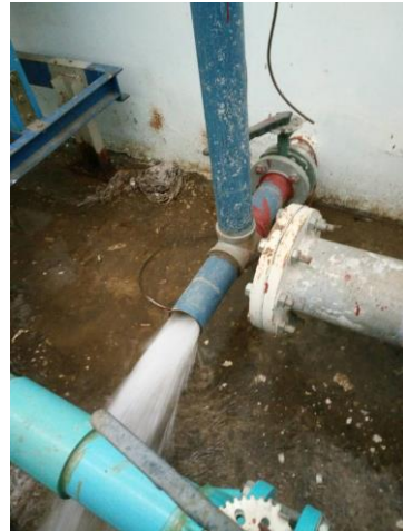
รูปที่ 2-8 แสดงการตรวจสอบและบำรุงรักษา ระบบท่อจ่ายน้ำ และสุขภัณฑ์